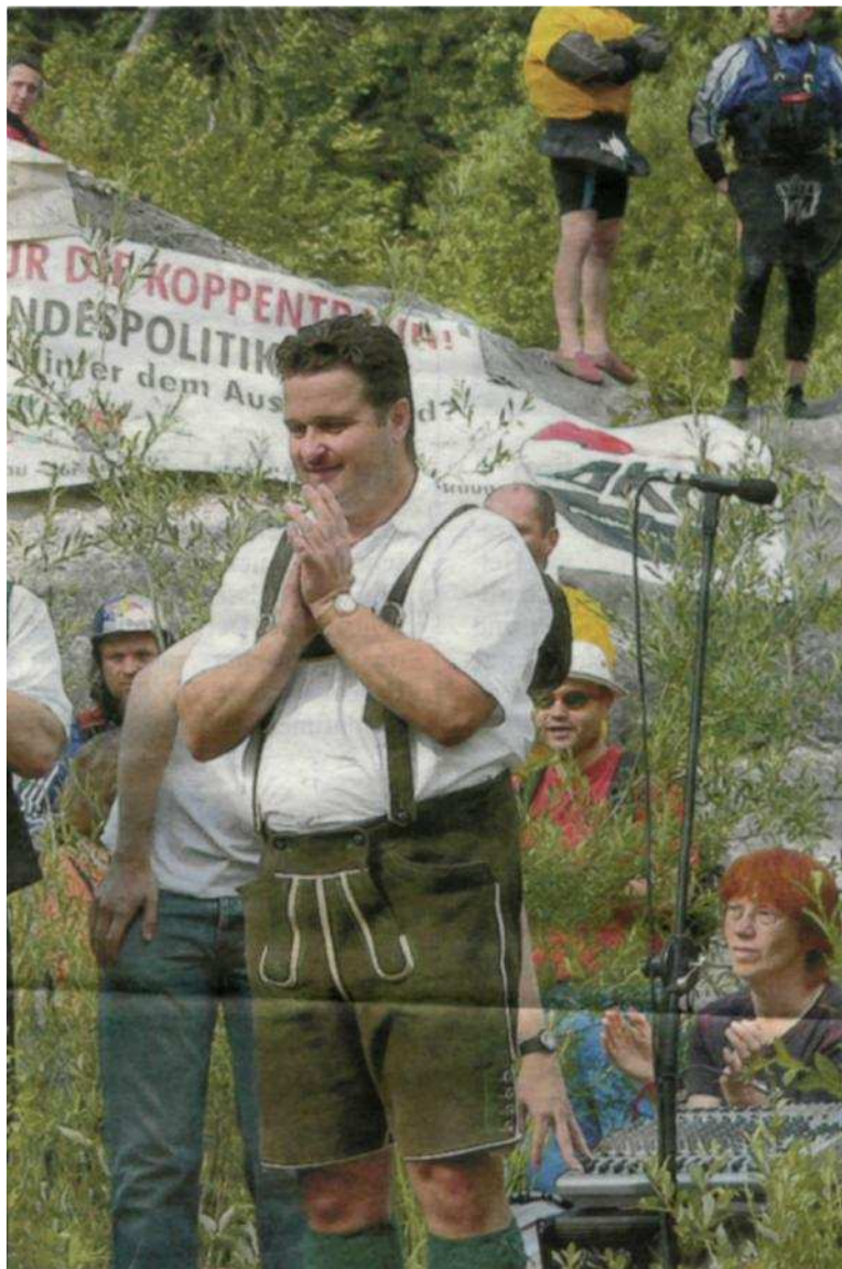
landes gab letztlich den Ausschlag zur Verhinderung des Projektes